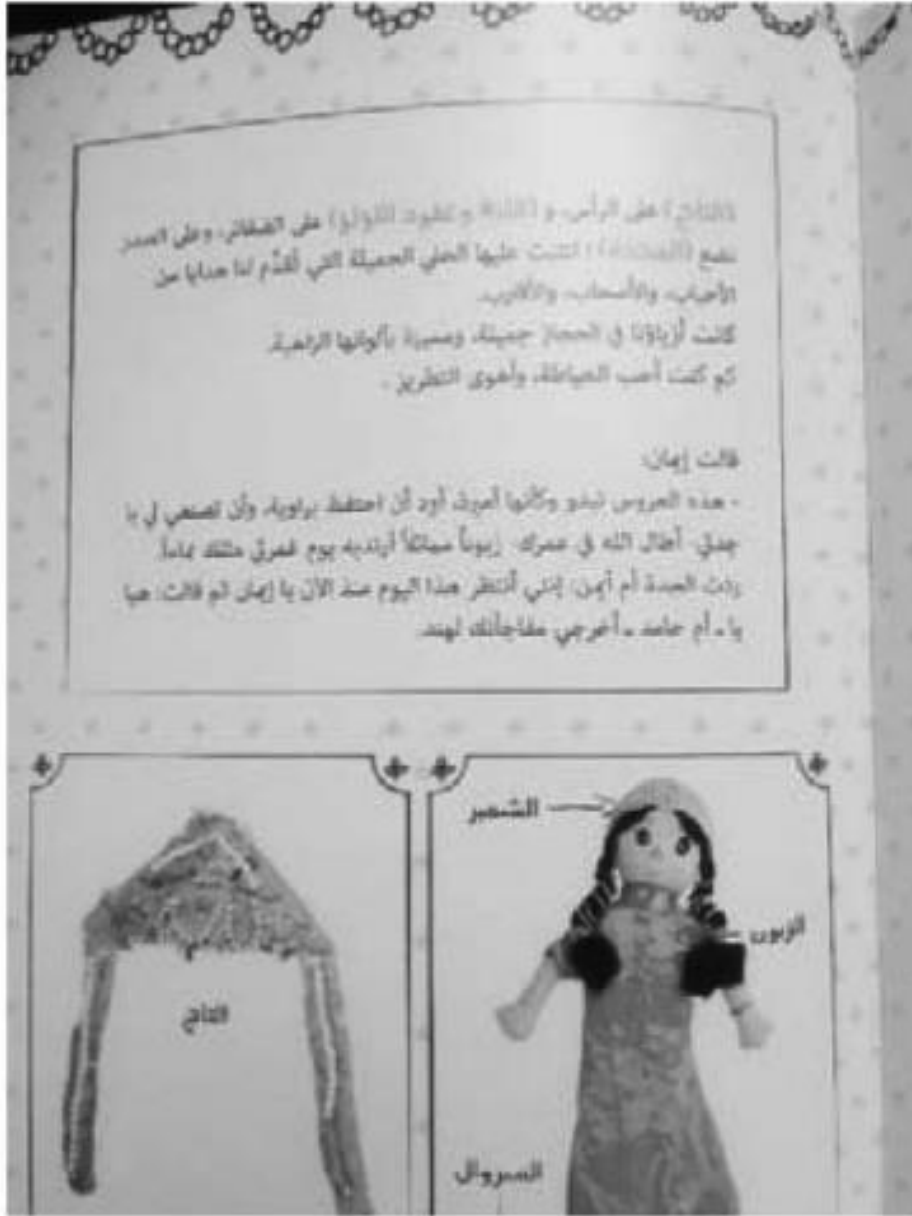
الشكل (3) - نموذج من صفحات القصة-زي المدينة