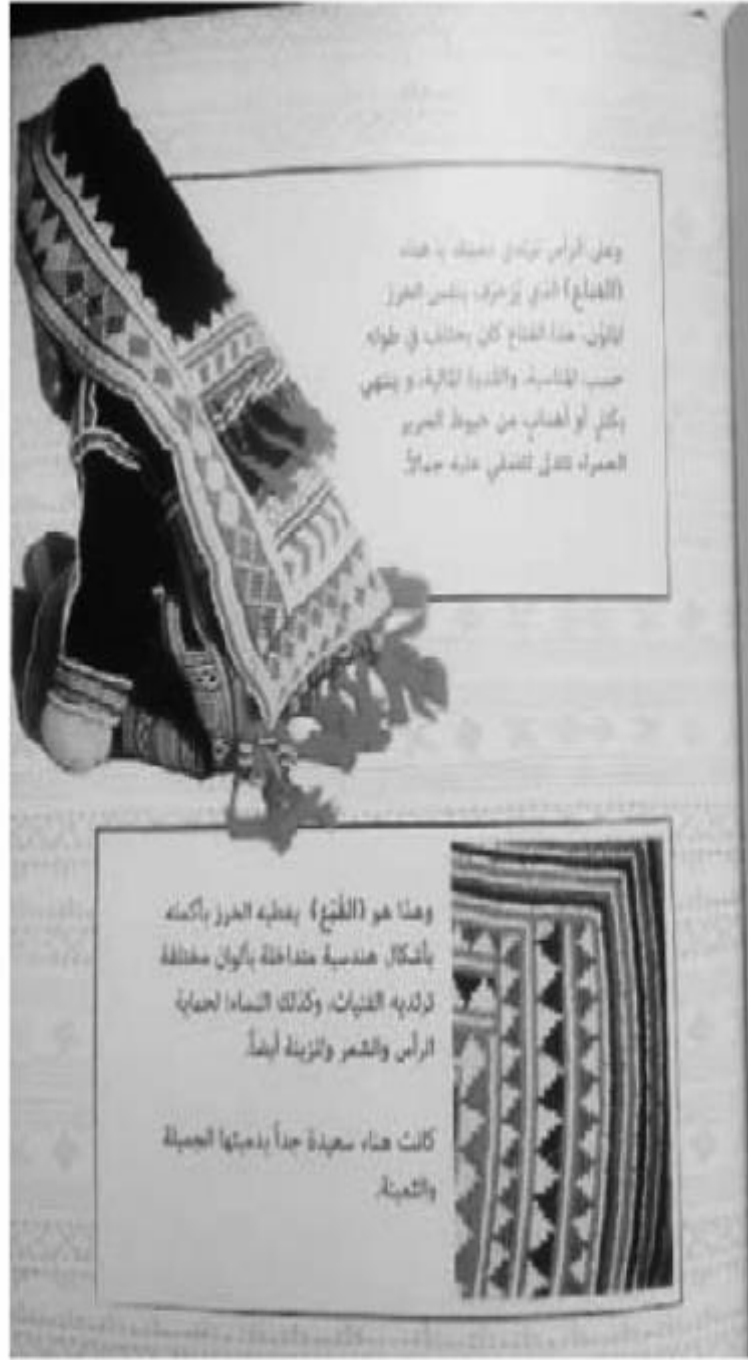
الشكل (2) - نموذج من صفحات القصة زي بني مالك