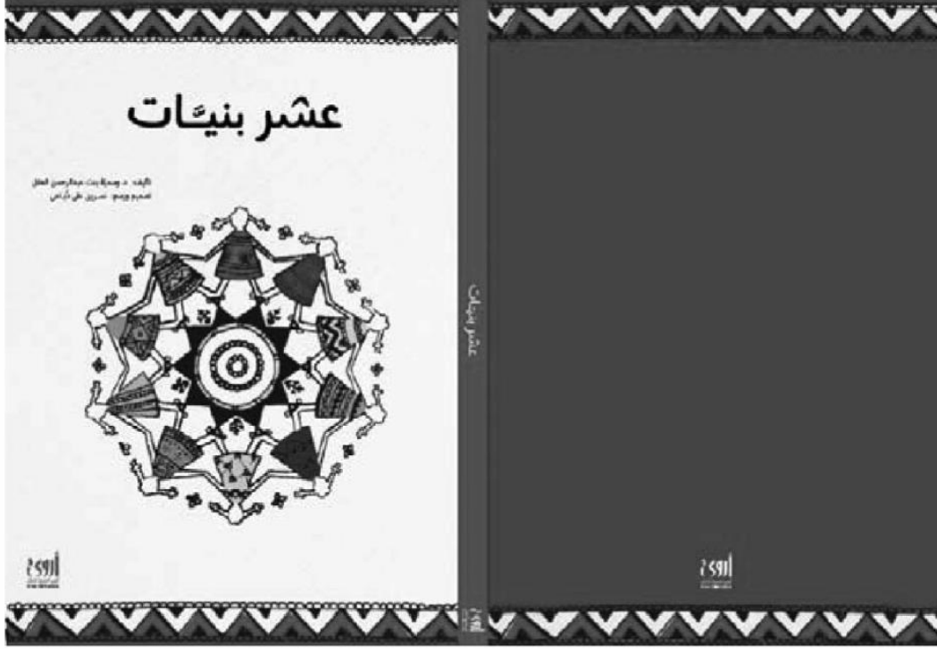
الشكل (1) - غلاف القصة

من الزخارف الشعبية، وقد نفذت ملابس الدمى بشكل دقيق يشبه القطع الأصلية، كما تم إخراج الكتاب ونشره عن طريق دار نشر سعودية متخصصة في كتب الأطفال. (مرفق القصة).